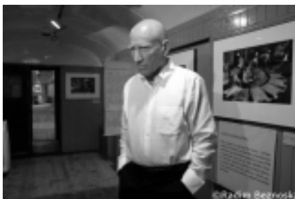
Sebastian Salgado na vernisáži svojej výstavy v Prahe.

ske-portugalsko-brazílske korene. V roku 1969 emigroval z rodnej Brazílie a nový domov našiel v Paríži. V tom čase úspešný medzinárodný ekonóm veľkej spoločnosti obchodujúcej s kávou a spolupracovník Svetovej banky ešte netušil, že jeho osudom sa stane fotografia. Jeho prvý kontakt s fotografovaním bol spojený s okamihom, keď si jeho žena kúpila počas štúdií v roku 1971 fotoaparát. „O dva roky neskôr som začal vážne fotiť,“ spomína dnes 61-ročný slávny fotograf. Prvé snímky urobil v Rwande, kde bol radíť roľníkom ako zakladať čajové a kávové plantáže. Učarovalo mu exotické prostredie, spriatelil sa s tamojšími obyvateľmi. Uvedomil si, ako je rozdelený svet, ako jeho