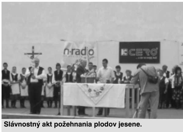
Slávnostný akt požehnanja plodov jesene.

vodných šiestich disciplín sa dievčatá stihli predviesť len v troch - predstavovanie, opis svojho mesta či obce v cudzom jazyku a ťahanie vína z džbánu heverom - voľbu kráľovnej totiž predčasne ukončil dážď. Dvanásťčlenná porota (v ktorej sedeli napri-