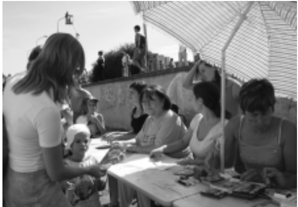
Zápis súťažiacich na súťaž v kreslení na asfalt.

zentáciu získali aj mladí nitrianski výtvarníci i spevácke talenty. O tradičnú atmosféru jarmoku sa postarali ľudoví remeselníci so svojimi výrobkami. V nedeľu súťažili rodiny v zbere PET-fliaš. Zápolenie malo osvetový charakter, jeho cieľom bolo nastoliť diskusiu o potrebe separovať odpad. V rám-