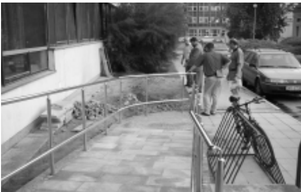
Hlavný vchod do budovy sa stal bezbariérový.