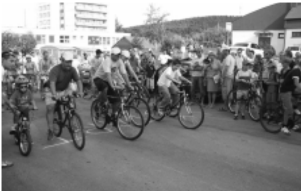
Mladá generácia čaká na štart.