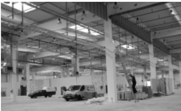
Výrobná hala firmy Visteon je zatiaľ prázdna, ale tento mesiac by sa už mala zaplniť výrobnou technológiou.

firma zamestnávať 400 pracovníkov s rôznou kvalifikáciou. Celé územie priemyselného parku Sever sa rozprestiera na 460 hektároch.