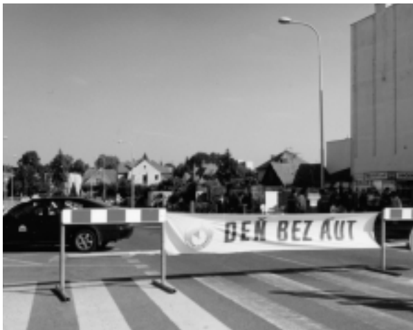
Táto fotografia je z minulého roka, keď bola Palárikova ulica zablokovaná športujúcimi deťmi a autá sem mali vjazd zakázaný.