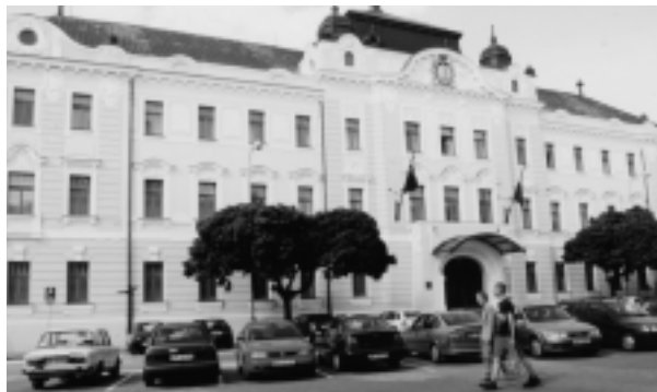
Ludová škola umenia sídlila aj v Župnom dome, kde je dnes Nitrianska galéria a je tu aj sídlo Nitrianskeho samosprávneho kraja.

Od r. 1988 sídli škola opäť v nových priestoroch. Zmenu si vynútila akútne potreba rozšírenia počtu tried, ktoré už kapacitne nepostačovali. Prestavovanie do bývalej budovy Stavoprojektu síce nebolo ideálne z hľadiska akusticky menej vyhovujúcich miestností, no na druhej strane sa žiakom z okolitých obcí zjednodušilo dochádzanie do centra mesta a škola mala stále všetky umelecké odbory na jednom mieste. Od r. 1990 škola nesie nový názov - Základná umelecká škola. V r. 1997 radikálny organizačný zásah narušil celistvosť jej fungovania a činnosť sa roztrúsila do štyroch budov. Dnes sa vyučuje v troch budovách - na Damborského ulici 1, na Ulici J. Vuruma 4 a na