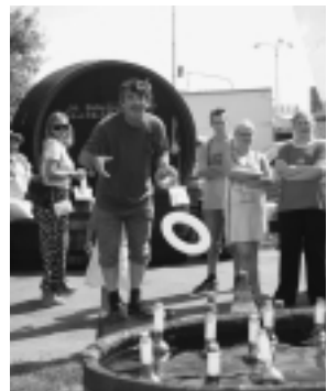
Dospelí si mohli zahádzať na fľaše vína a vyhrať ich.