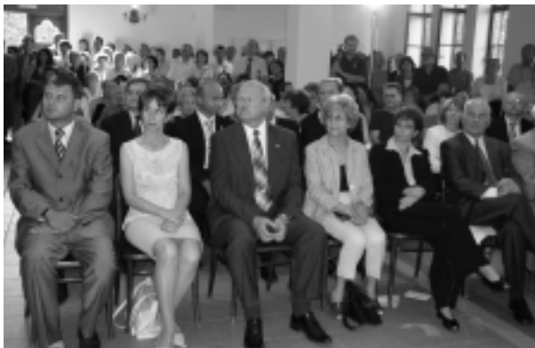
Na vernisáži sa zúčastnilo niekoľko významných slovenských osobností.

Výstavu, ktorá pozostáva z artefaktov, pripomínajúcich ťažké osudy slovenských židov, pripravilo Mesto Nitra v spolupráci s Ministerstvom