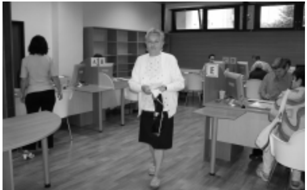
Pohľad na hlavnú časť klientskeho centra.

Občania sa môžu orientovať aj pomocou veľkopoštovej obrazovky, umiestnenej nad okienkom informátora vo vestibule, na ktorej sa premietajú vždy aktuálne informácie a údaje.